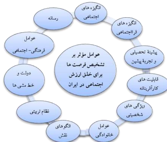
شکل ۱. الگوی حاصل از تحلیل داده‌ها در مرحله کدگذاری نظری