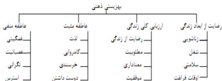
شکل ۱- ساختار سلسله‌مراتبی: ابعاد بهزیستی ذهنی

داینر، اسکن و لوکاس ۲ (۲۰۰۹) برای بهزیستی ذهنی، ابعادی قائل هستند که با عنوان ساختار سلسله‌مراتب مفهوم شناخته شده‌اند. بنا به اعتقاد آن‌ها این مفهوم دارای چهار بعد اصلی است که هر کدام از آن‌ها نیز با چهار بعد فرعی مشخص می‌شوند. یکی از این ابعاد اصلی، رضایت از ابعاد زندگی می‌باشد که ابعاد فرعی آن عبارت‌اند از: رضایت از زندگی زناشویی، رضایت شغلی، رضایت از وضعیت سلامتی و رضایت از اوقات فراغت.